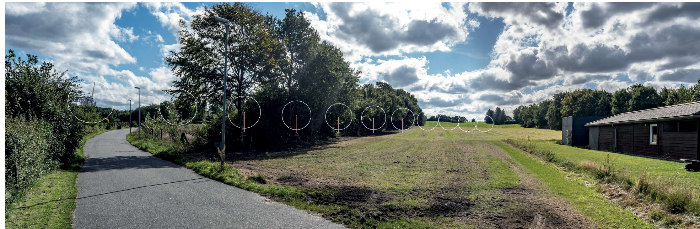
6 Sammensat panorama: eksisterende forhold (øverst) og visualisering af fremtidige forhold (nederst).