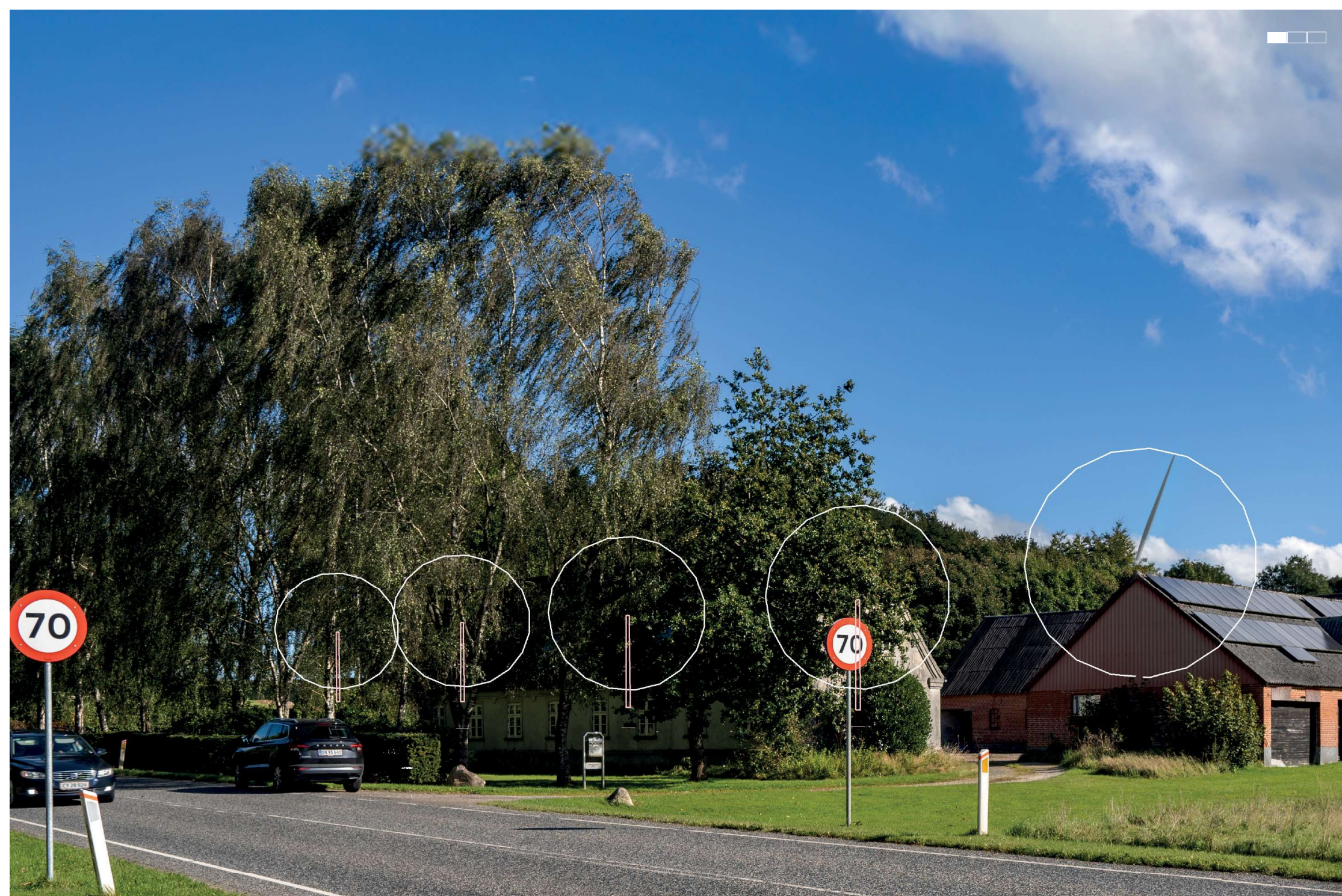
5 Visualisering af projektforslaget, venstre del af 3-delt panorama, 50 mm