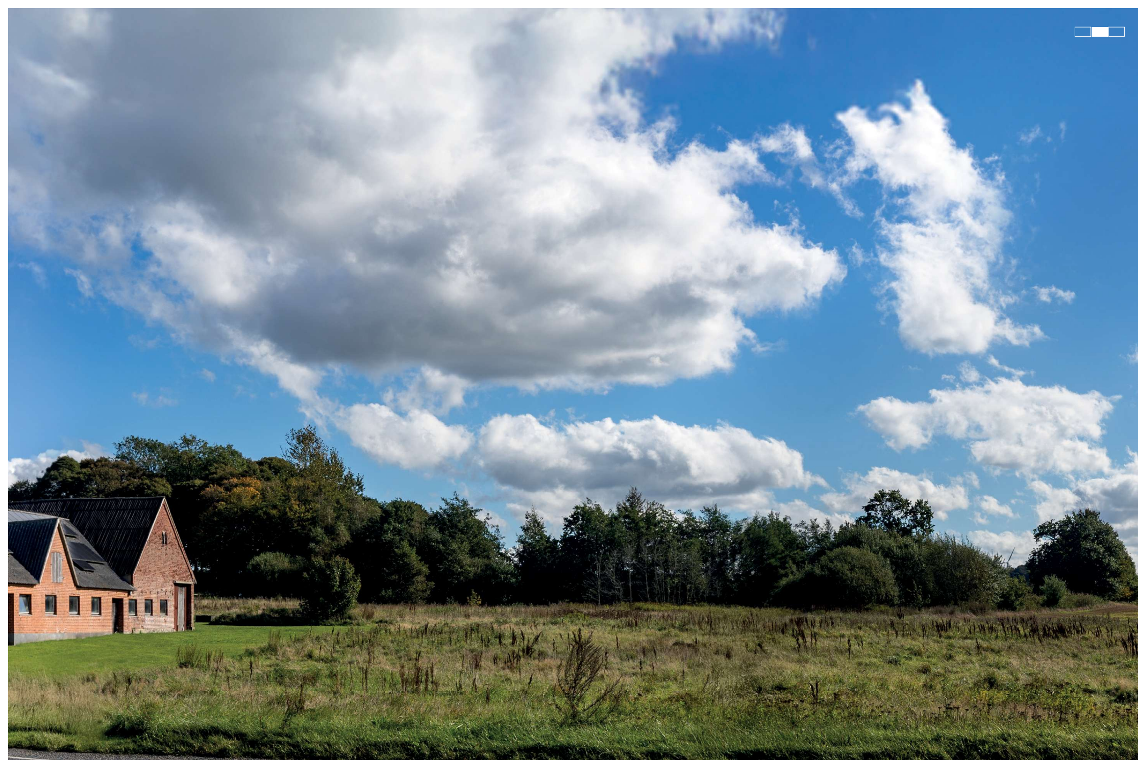
5 Eksisterende forhold, midterste del af 3-delt panorama, 50 mm