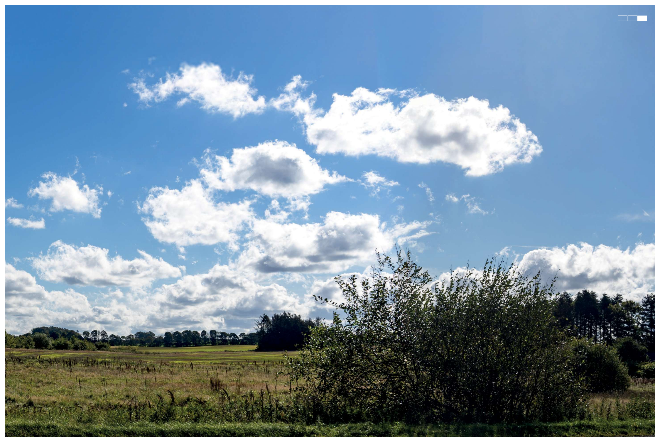
5 Eksisterende forhold, højre del af 3-delt panorama, 50 mm