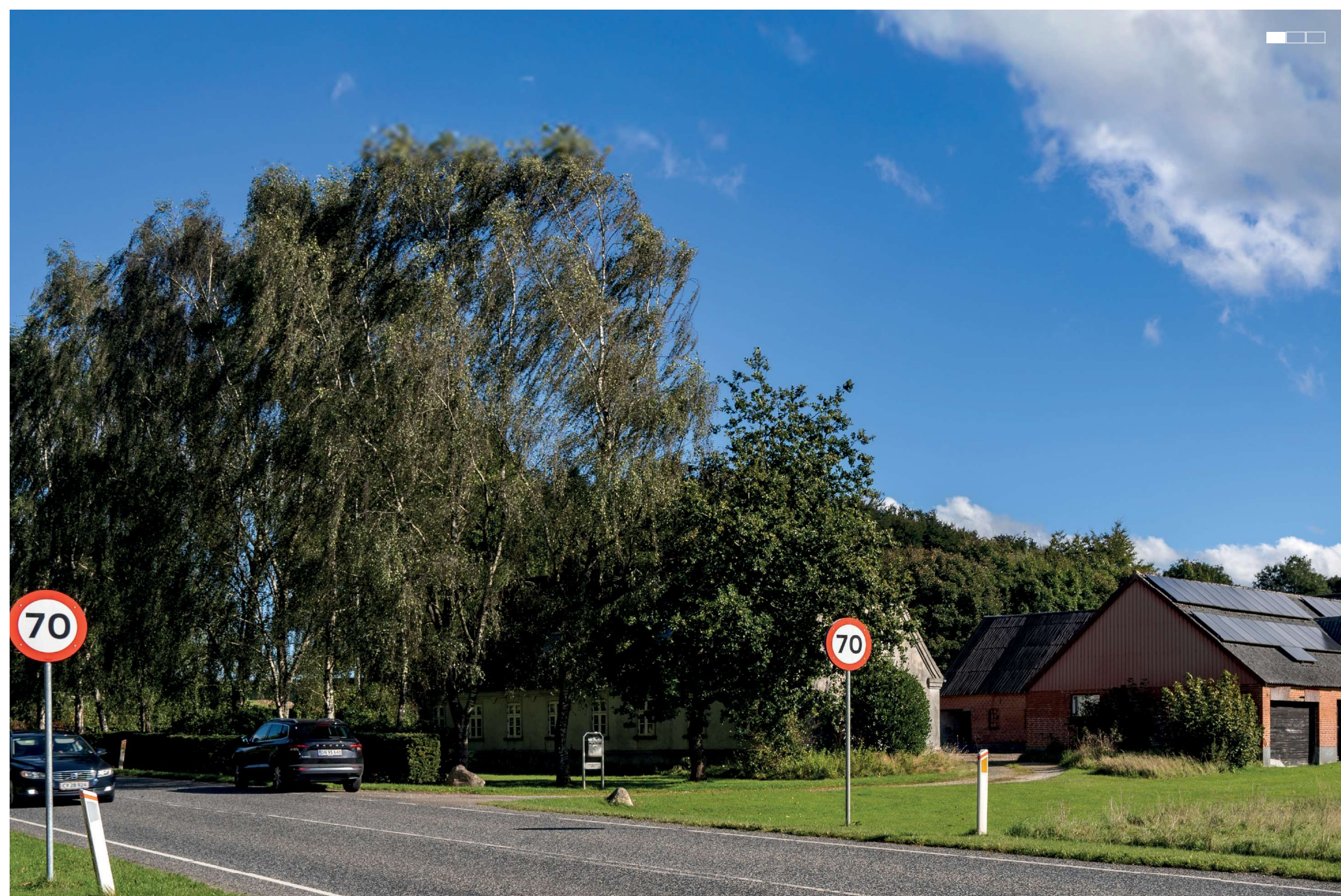
5 Eksisterende forhold, venstre del af 3-delt panorama, 50 mm