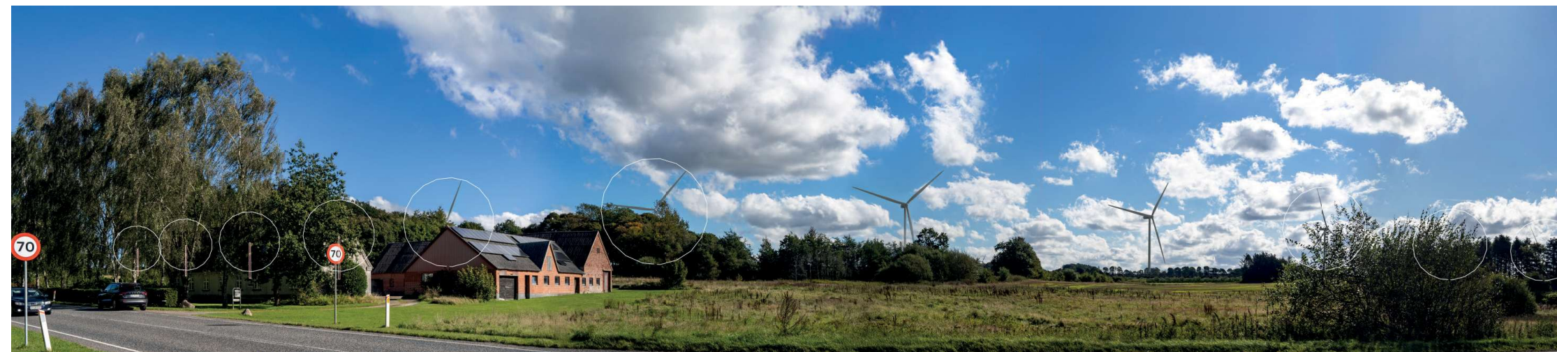
5 Sammensat panorama: eksisterende forhold (øverst) og visualisering af fremtidige forhold (nederst).