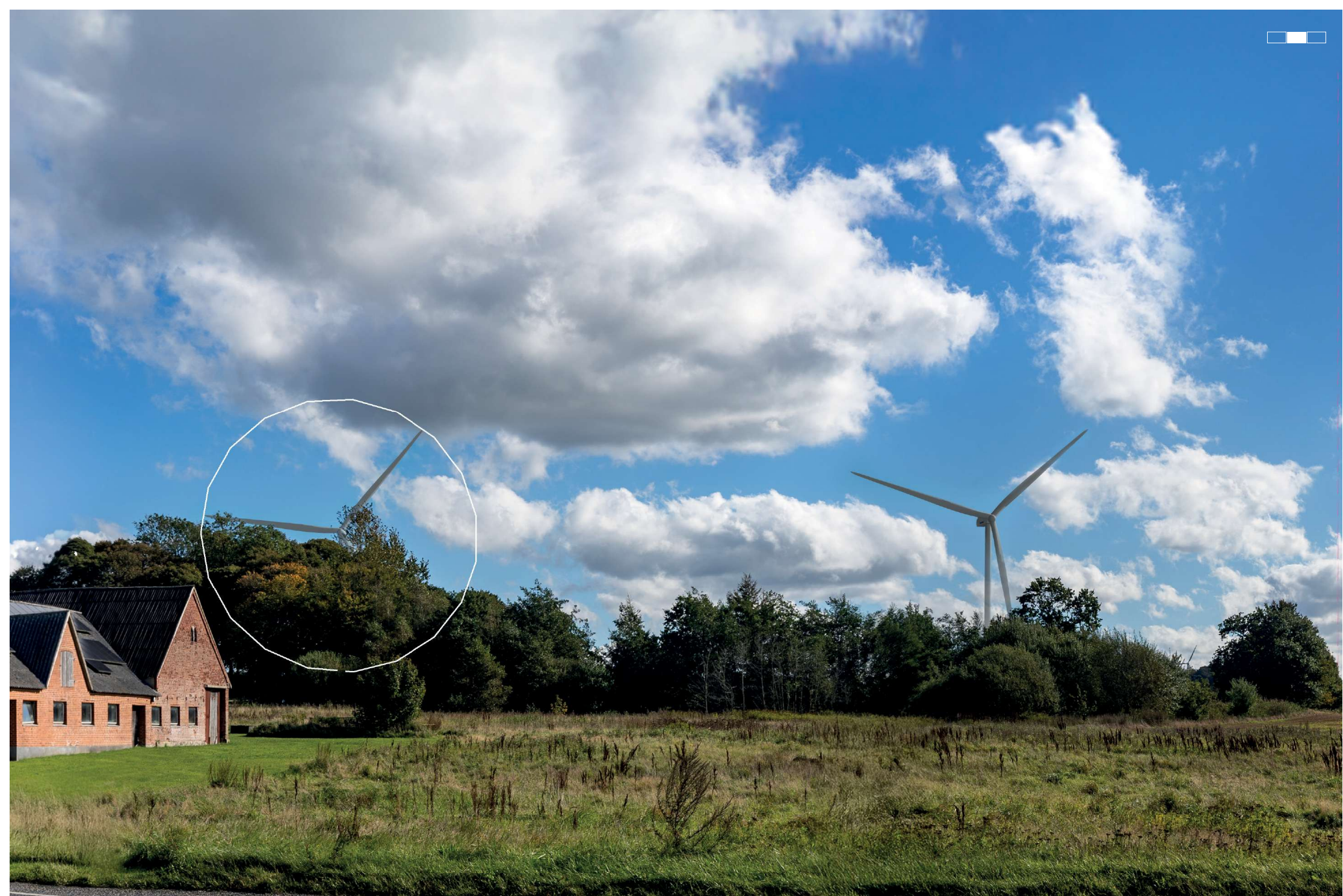
5 Visualisering af projektforslaget, midterste del af 3-delt panorama, 50 mm