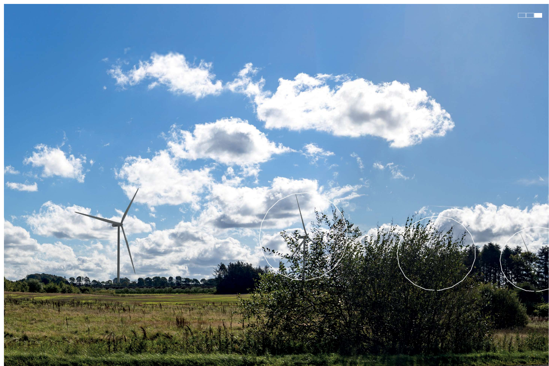
5 Visualisering af projektforslaget, højre del af 3-delt panorama, 50 mm