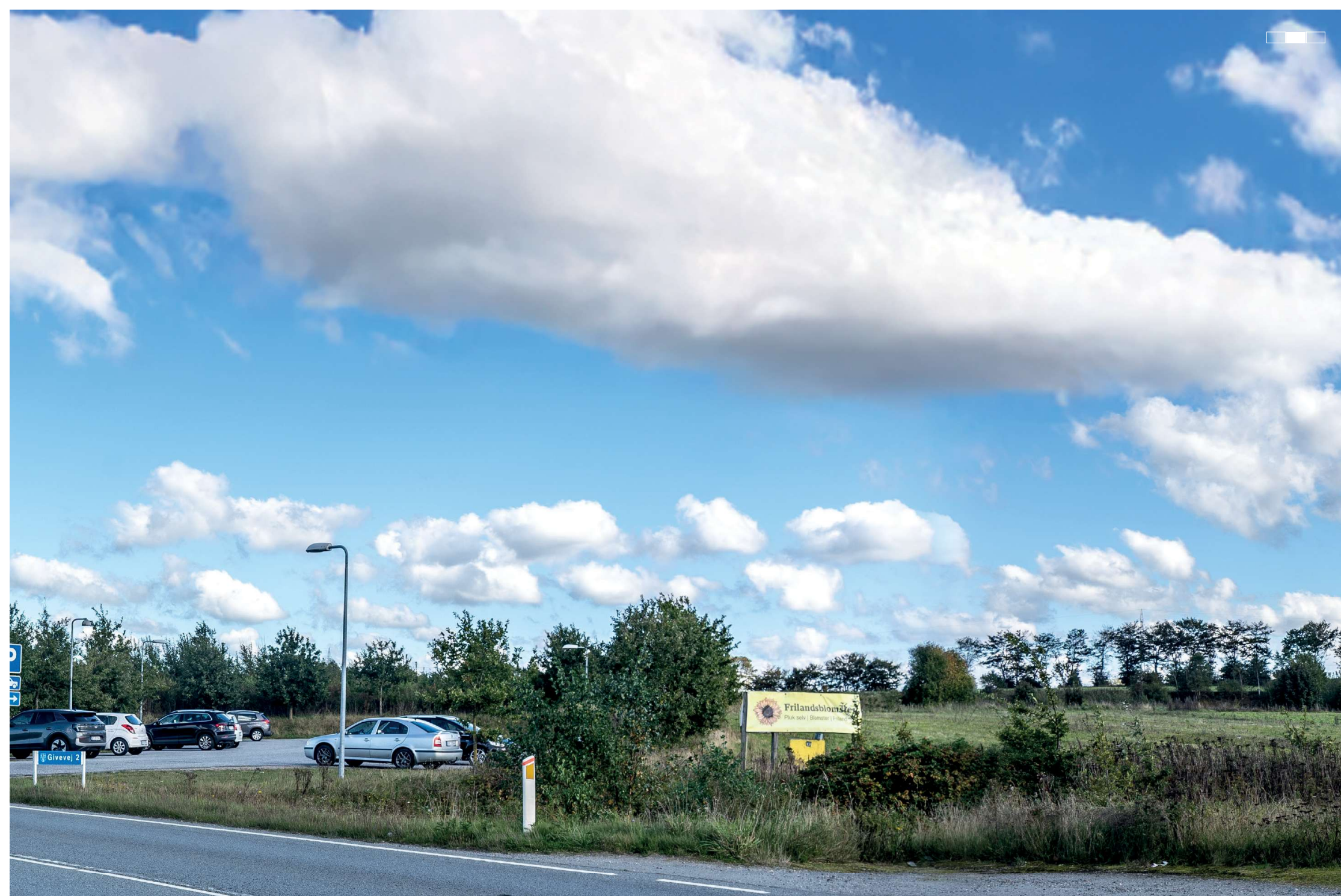
4 Eksisterende forhold, midterste del af 3-delt panorama, 50 mm