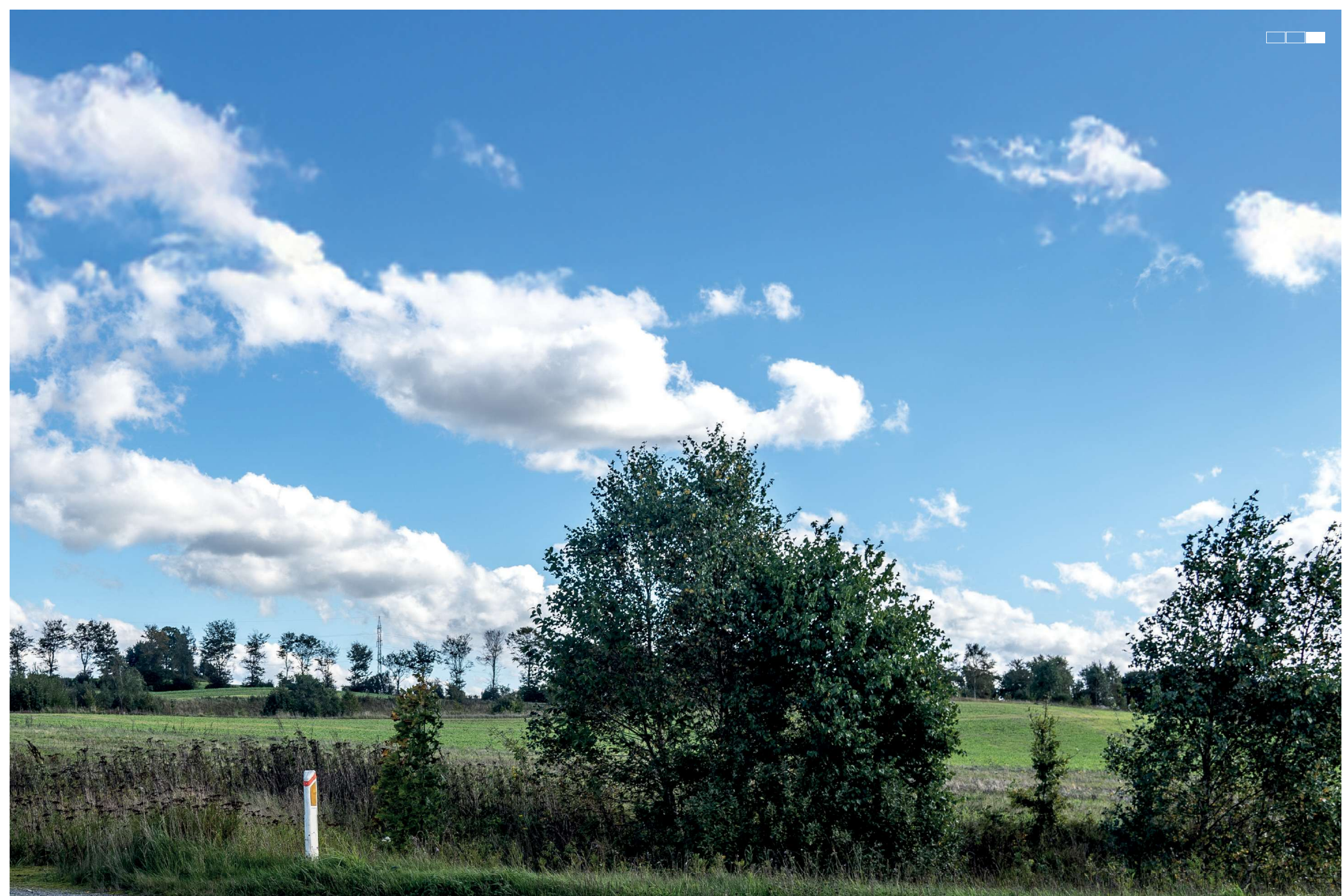
4 Eksisterende forhold, højre del af 3-delt panorama, 50 mm