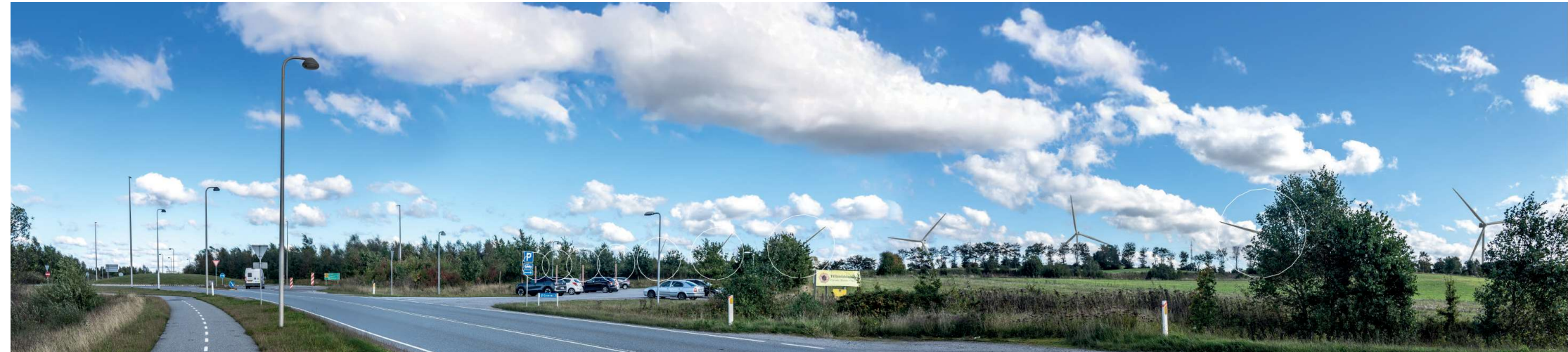
4 Sammensat panorama: eksisterende forhold (øverst) og visualisering af fremtidige forhold (nederst).