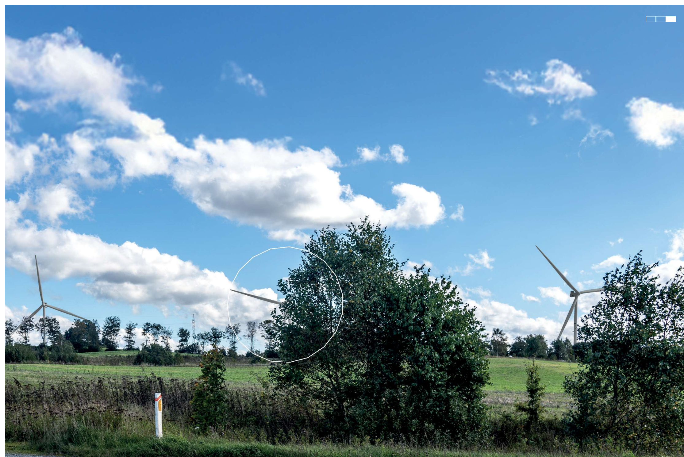
4 Visualisering af projektforslaget, højre del af 3-delt panorama, 50 mm