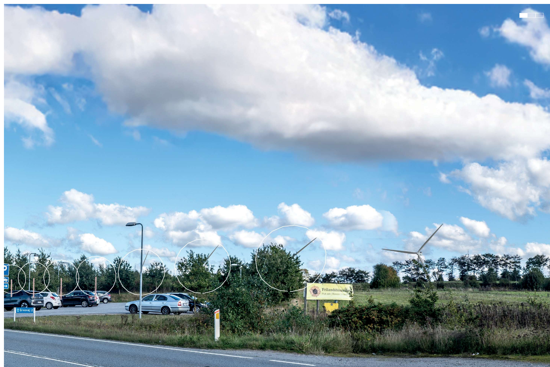
4 Visualisering af projektforlaget, midterste del af 3-delt panorama, 50 mm