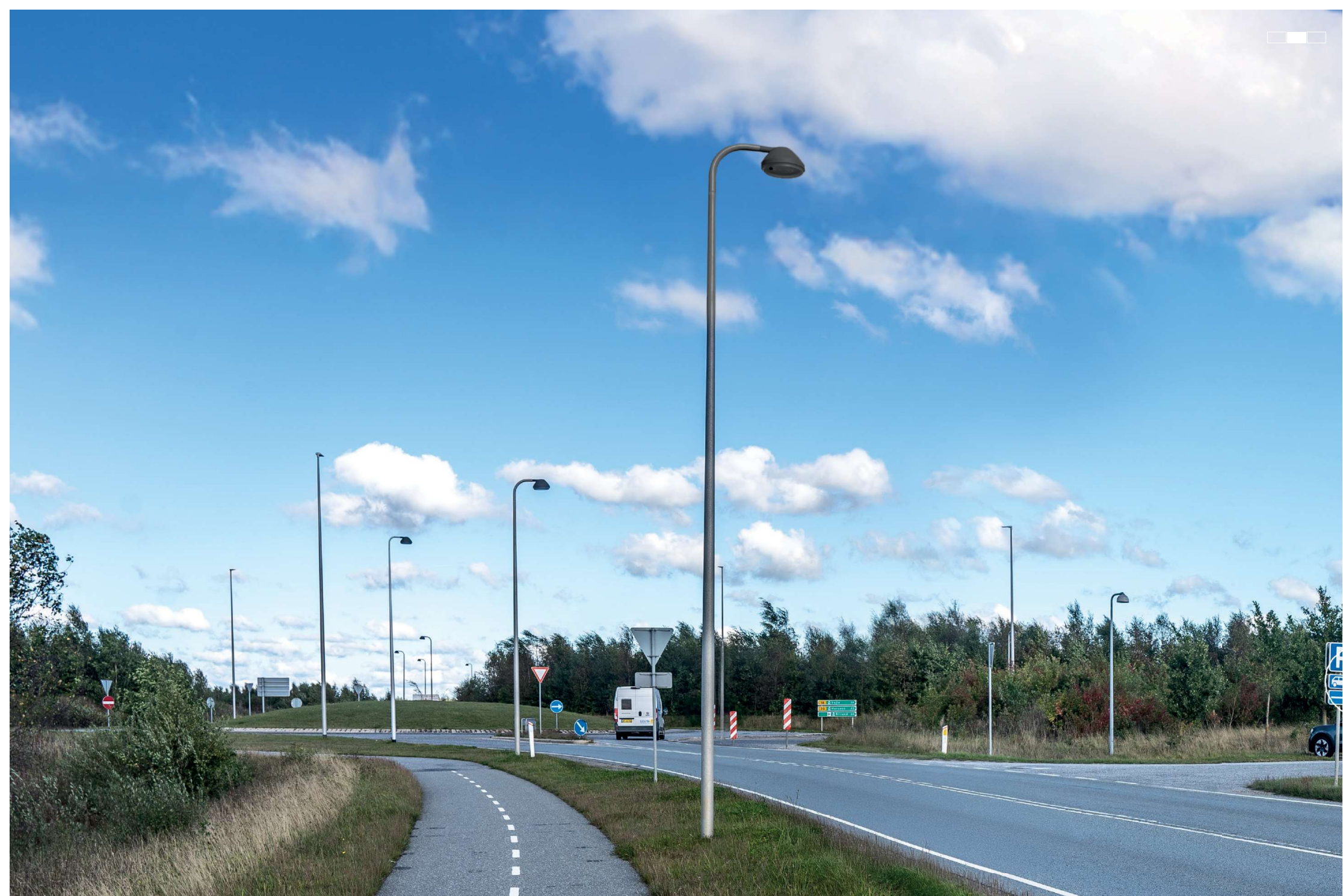
4 Visualisering af projektforslaget, venstre del af 3-delt panorama, 50 mm