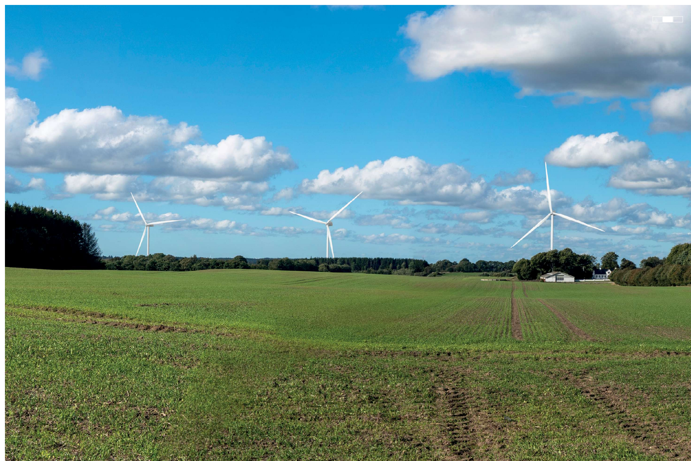
3 Visualisering af projektforslaget, venstre del af 3-delt panorama, 50 mm