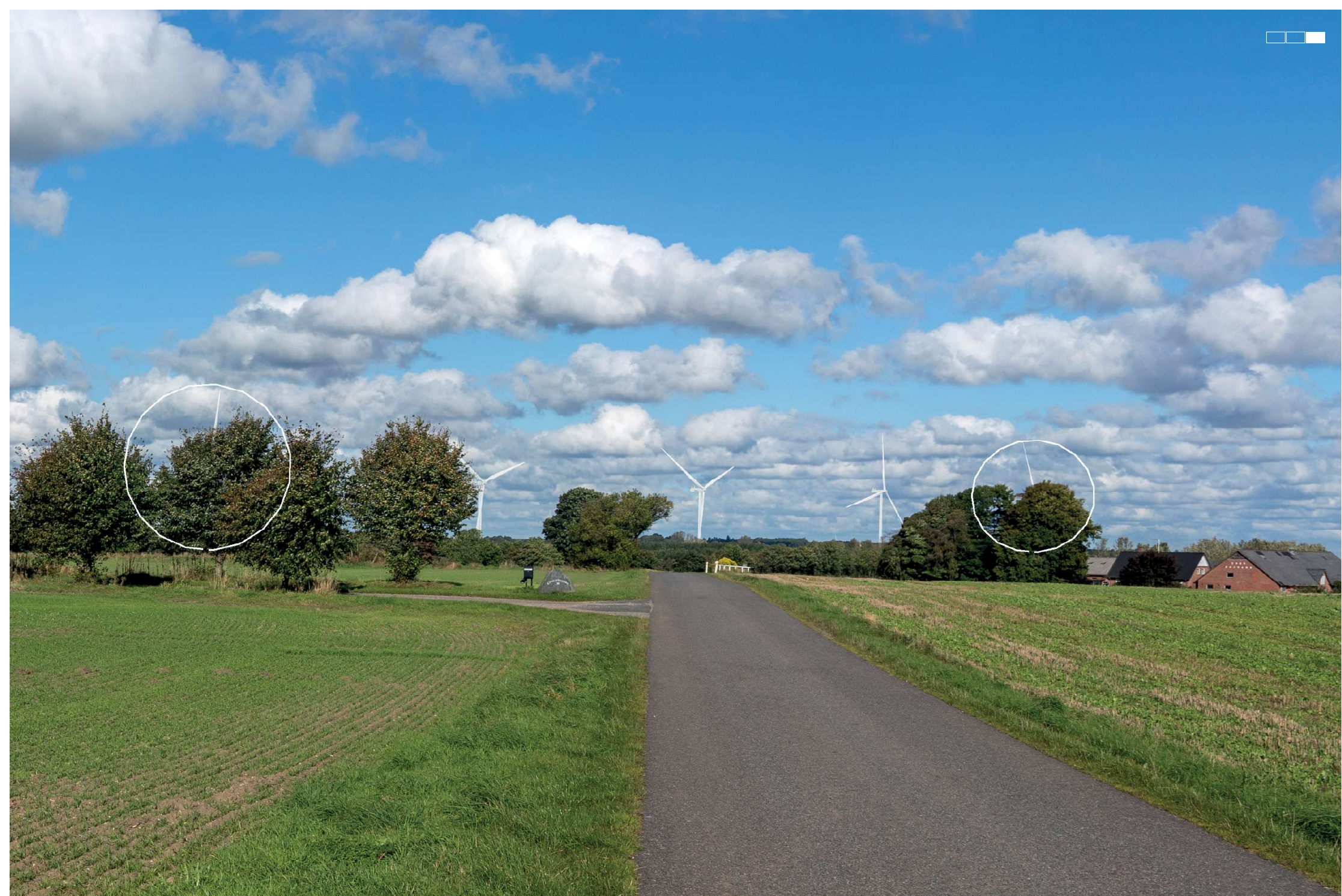
3 Visualisering af projektforslaget, højre del af 3-delt panorama, 50 mm