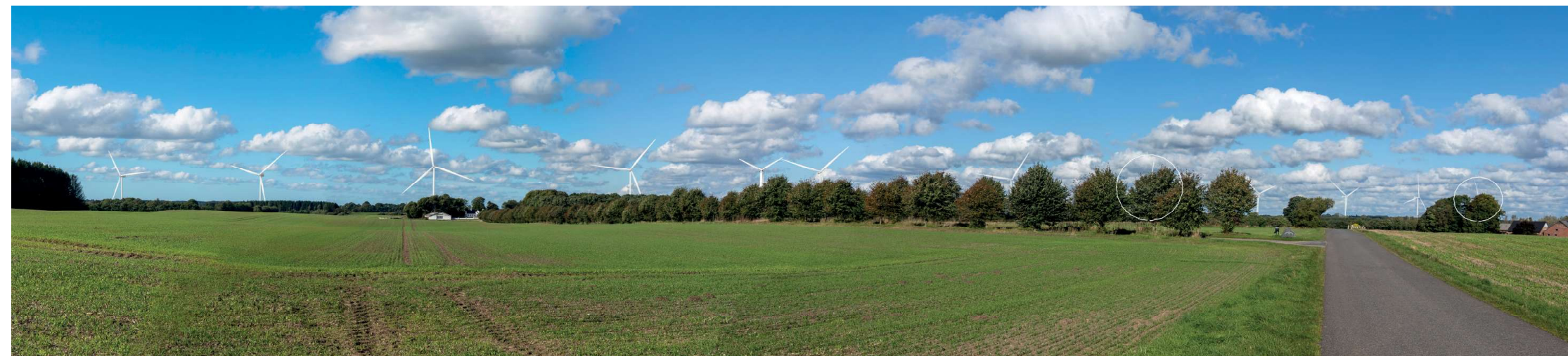
3 Sammensat panorama: eksisterende forhold (øverst) og visualisering af fremtidige forhold (nederst).