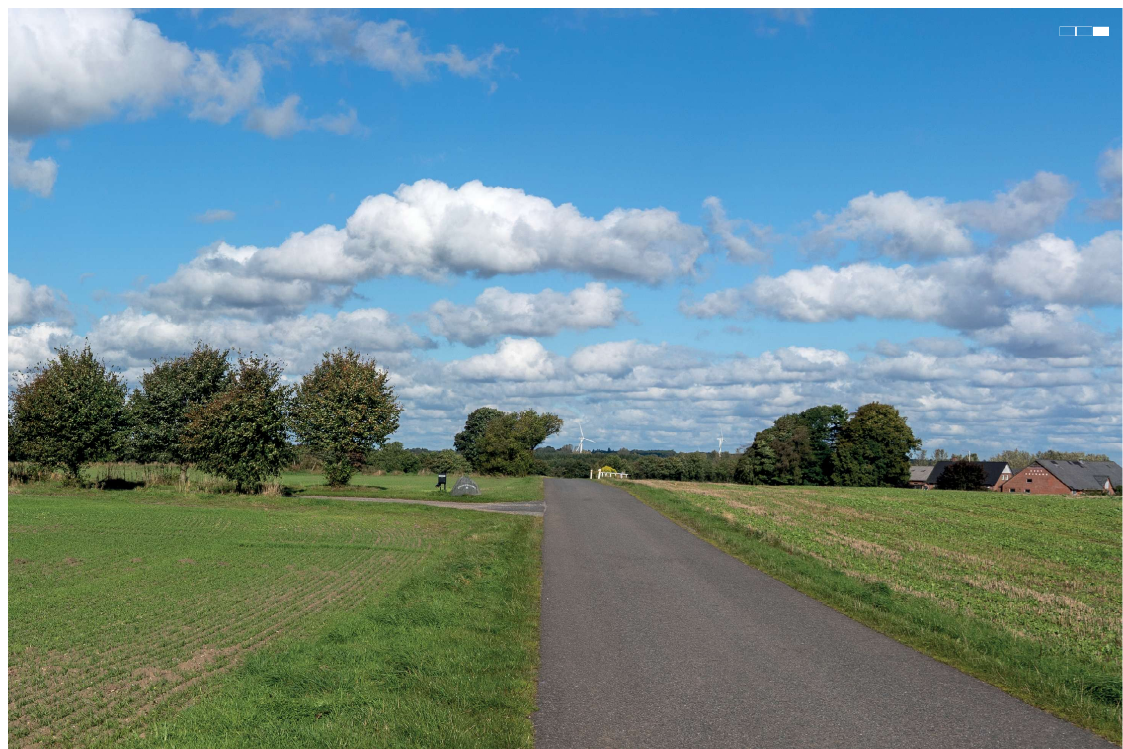
3 Eksisterende forhold, højre del af 3-delt panorama, 50 mm