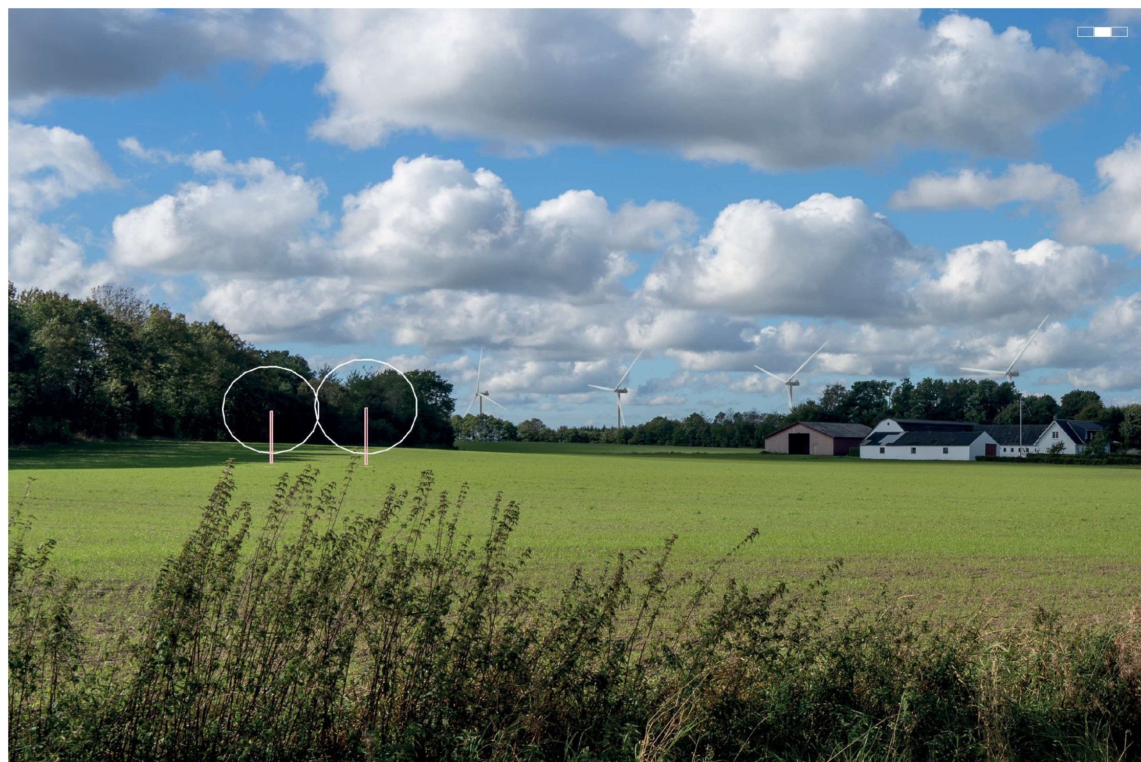
2 Visualisering af projektforslaget, venstre del af 3-delt panorama, 50 mm