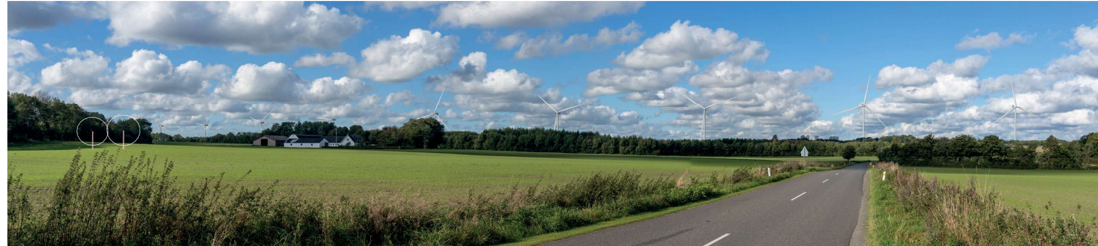
2 Sammensat panorama: eksisterende forhold (øverst) og visualisering af fremtidige forhold (nederst).