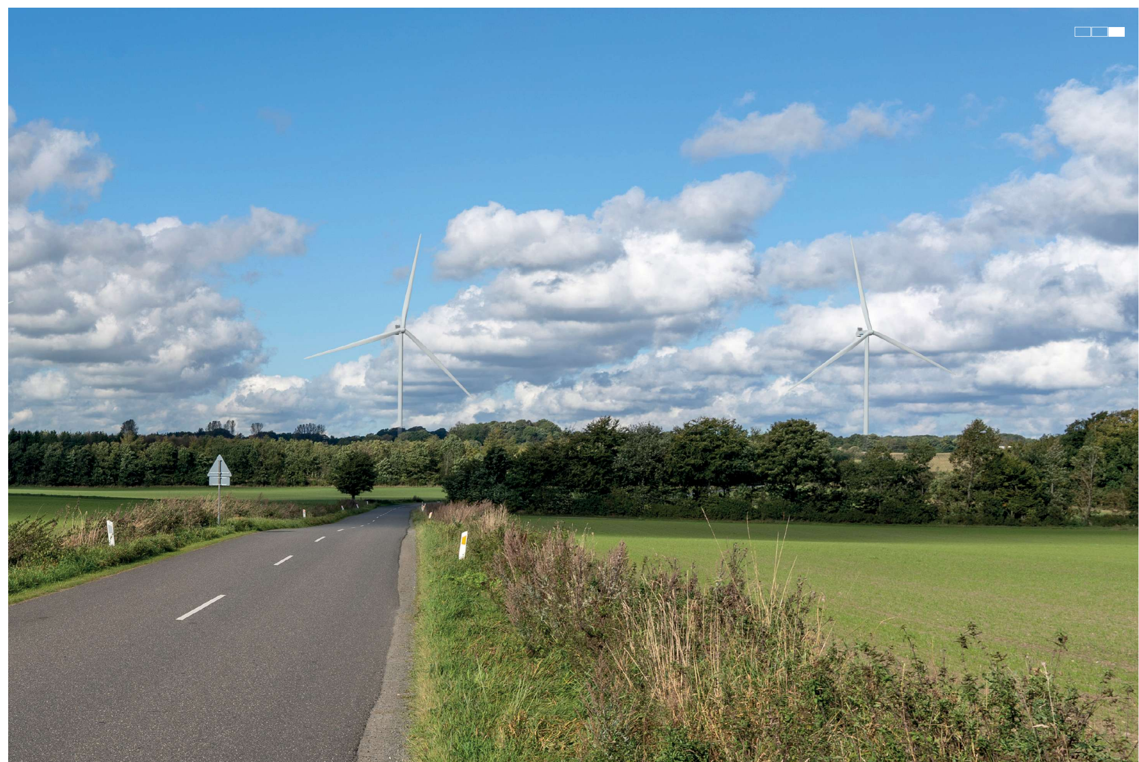
2 Visualisering af projektforslaget, højre del af 3-delt panorama, 50 mm