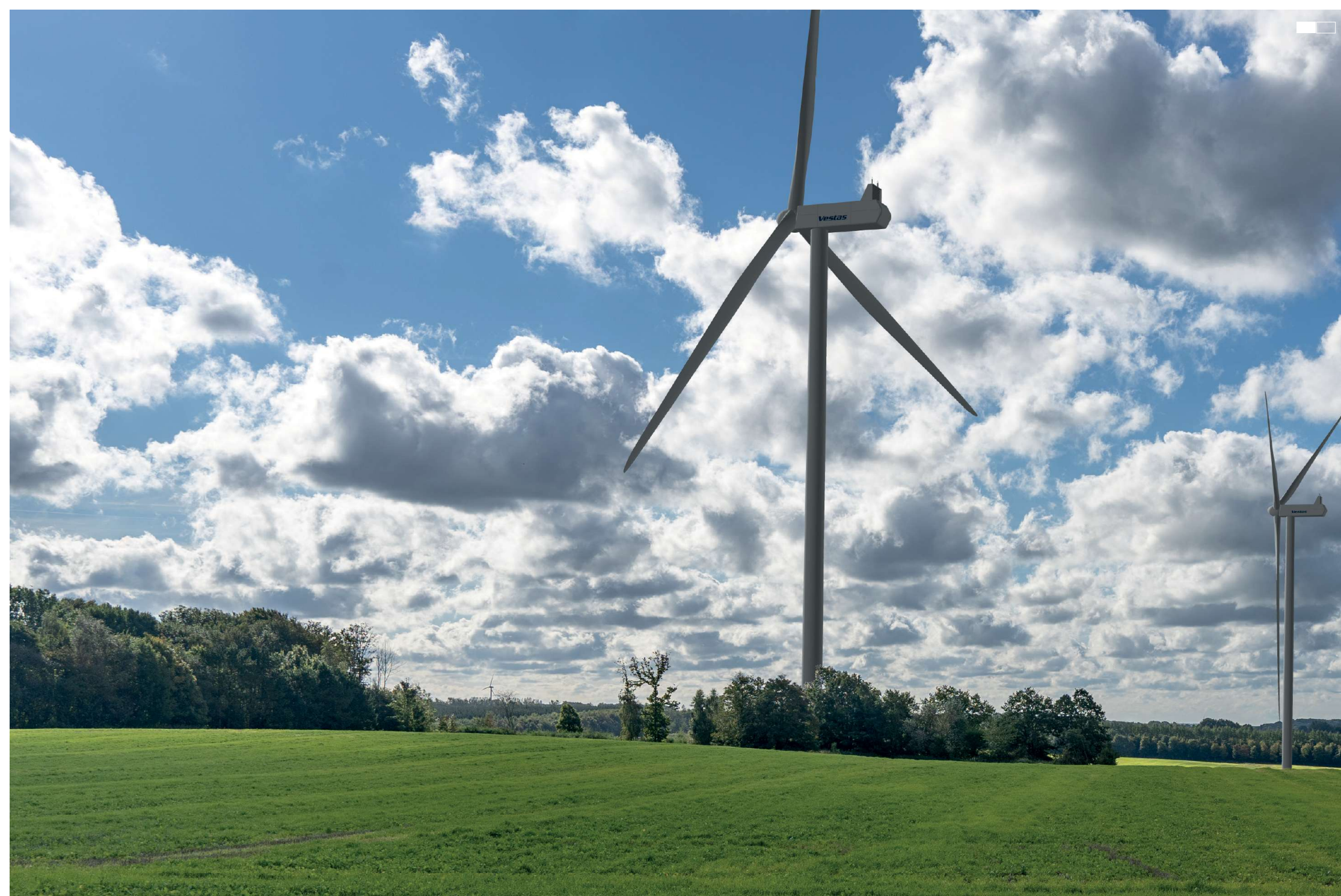
1 Visualisering, 1. del 2-delt panorama, 50 mm.