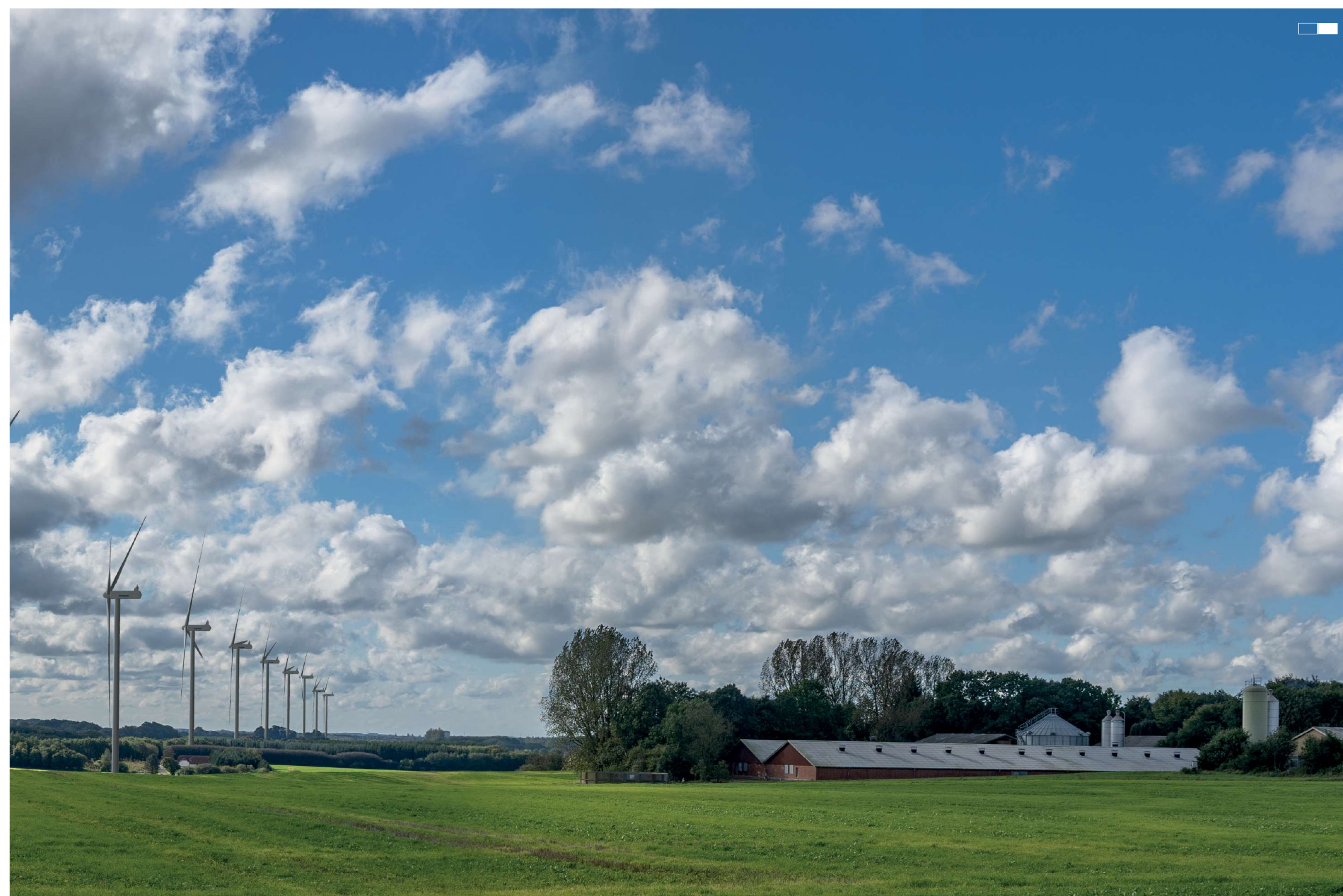
1 Visualisering, 2. del 2-delt panorama, 50 mm.