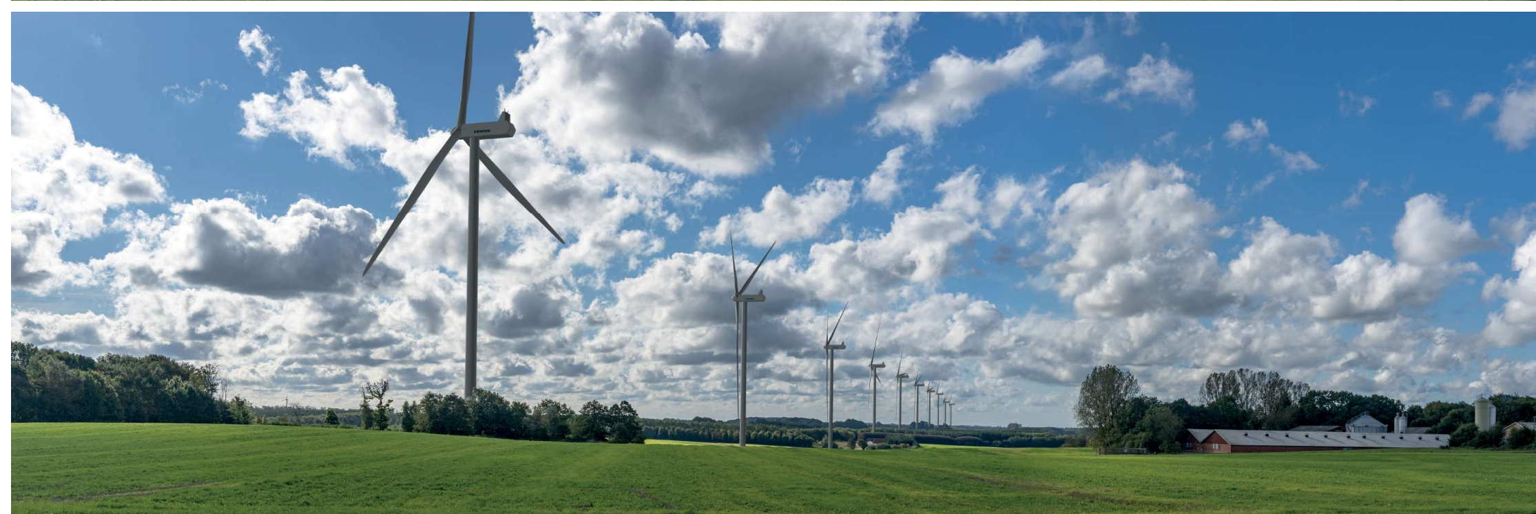
1 Sammensat panorama: eksisterende forhold (øverst) og visualisering af fremtidige forhold (nederst).